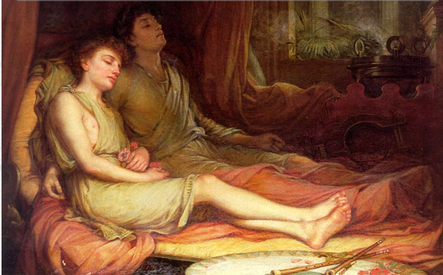
John William Waterhouse "Hypnos and Thanatos, Sleep and His Half-Brother Death"